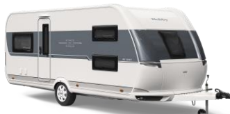
DE LUXE FAMILIENFREUNDLICHE 18 Grundrisse