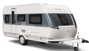
ONTOUR EINSTEIGER 4 Grundrisse