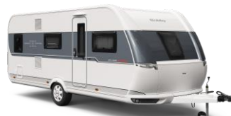
DE LUXE EDITION SPORTLICHE 6 Grundrisse