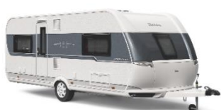
EXCELLENT ELEGANTE 13 Grundrisse