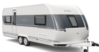
PRESTIGE GROßARTIGE 11 Grundrisse