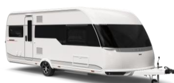
PREMIUM EINZIGARTIGE 6 Grundrisse

* Ausführlichere Informationen zu den Baureihen finden Sie im Anhang