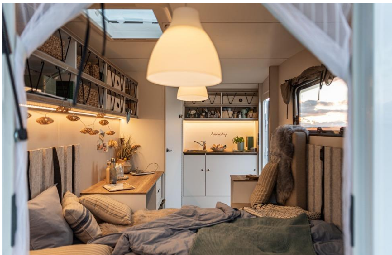
Minimalistisch, individuell, flexibel – mit diesem Konzept überzeugt der BEACHY auch international.