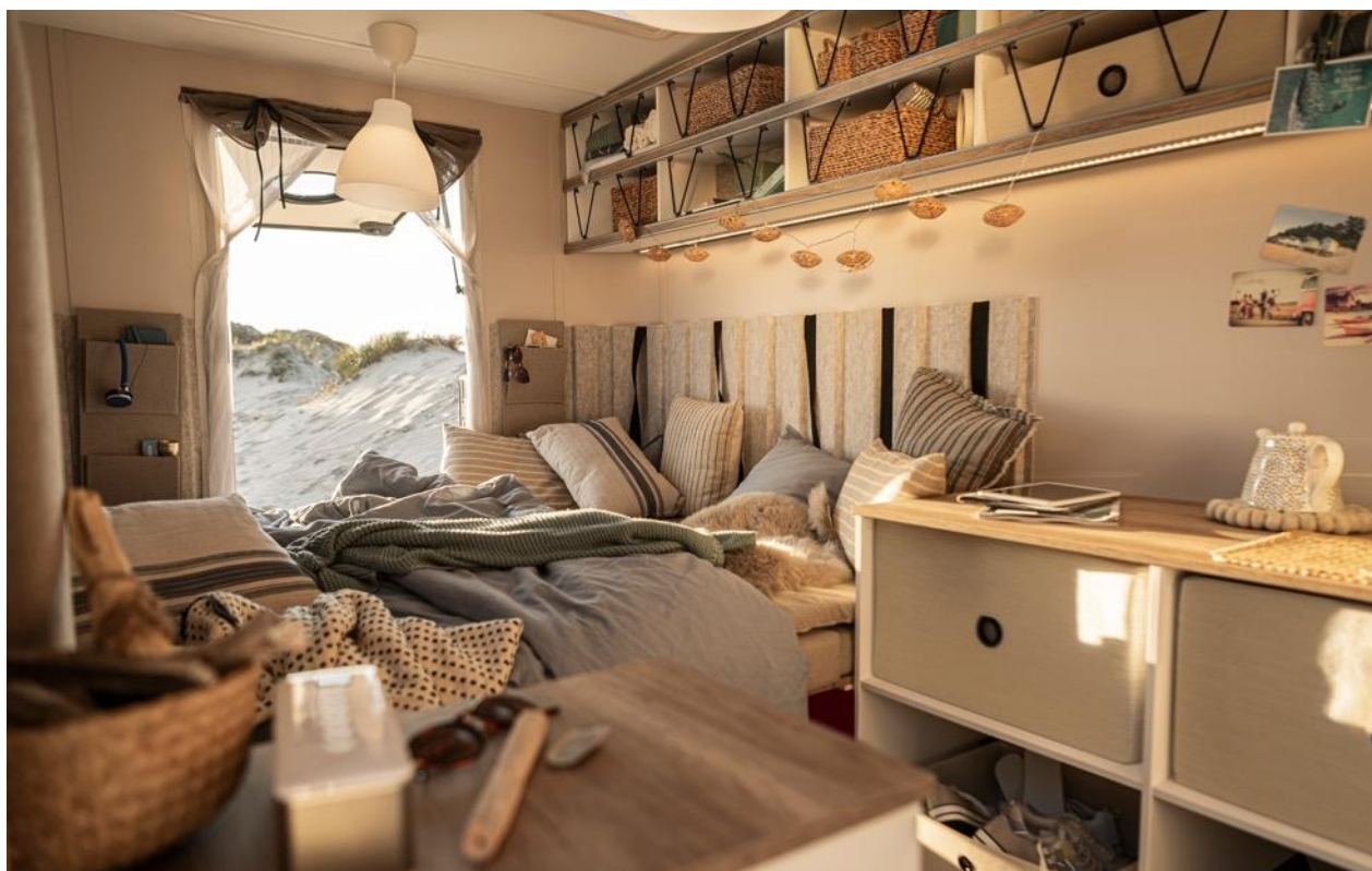
La porte arrière de la BEACHY reste l'un des points forts du concept.