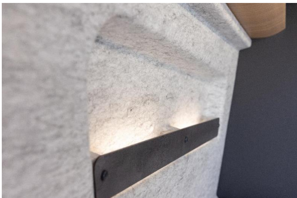
Die graue V-Flex-Filzoptikverkleidung für Dach und Seitenwände.

Jede Menge Stauraumlösungen und der kompakte Waschraum mit integrierter Dusche und WC sorgen für Komfort. Der multifunktionale Heckbereich des VANS bietet neben praktischen Schrankelementen mit Stauraum für die Bordtechnik, Schubladen und Fächern dabei auch Platz für die zwei ausziehbaren 11-kg-Gasflaschen. Auch die durchdacht verbauten Küchenelemente wie der 90-L-Kompressor-Kühlschrank, die Kocher-Spüle-Kombi mit 2-Flammkocher und elektrischer Zündung wissen zu überzeugen. Eine ausklappbare Arbeitsplattenerweiterung und Küchenschubladen mit Push-Locks und Soft-Close-Mechanik sind ebenso verbaut. Ein weiteres Feature: Die Slide-Out-Sitzbank ist nicht nur nach vorn und seitlich verschiebbar, sondern dazu auch äußerst ergonomisch und mit Drei-Punkt-Sicherheitsgurten ausgestattet.