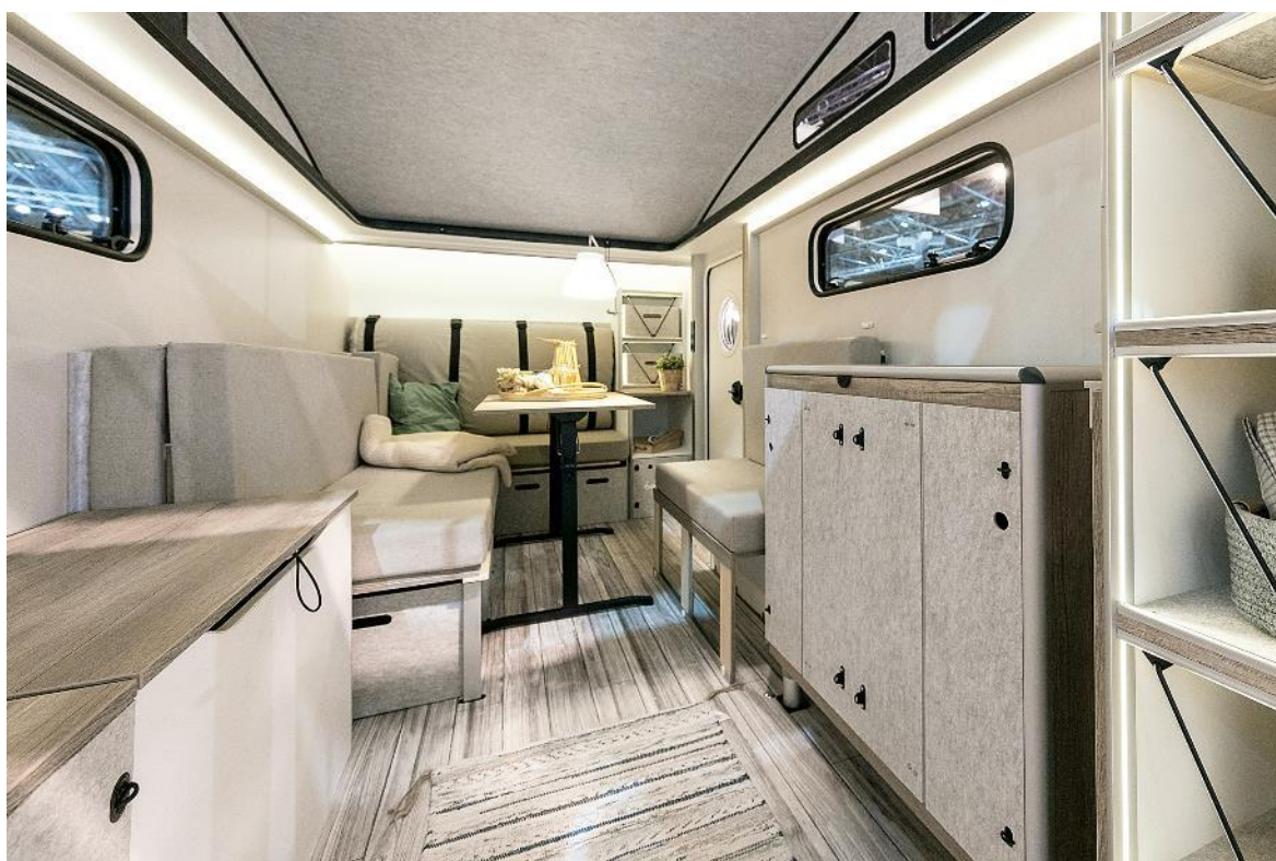
Le BEACHY AIR au Salon de la caravane 2022.