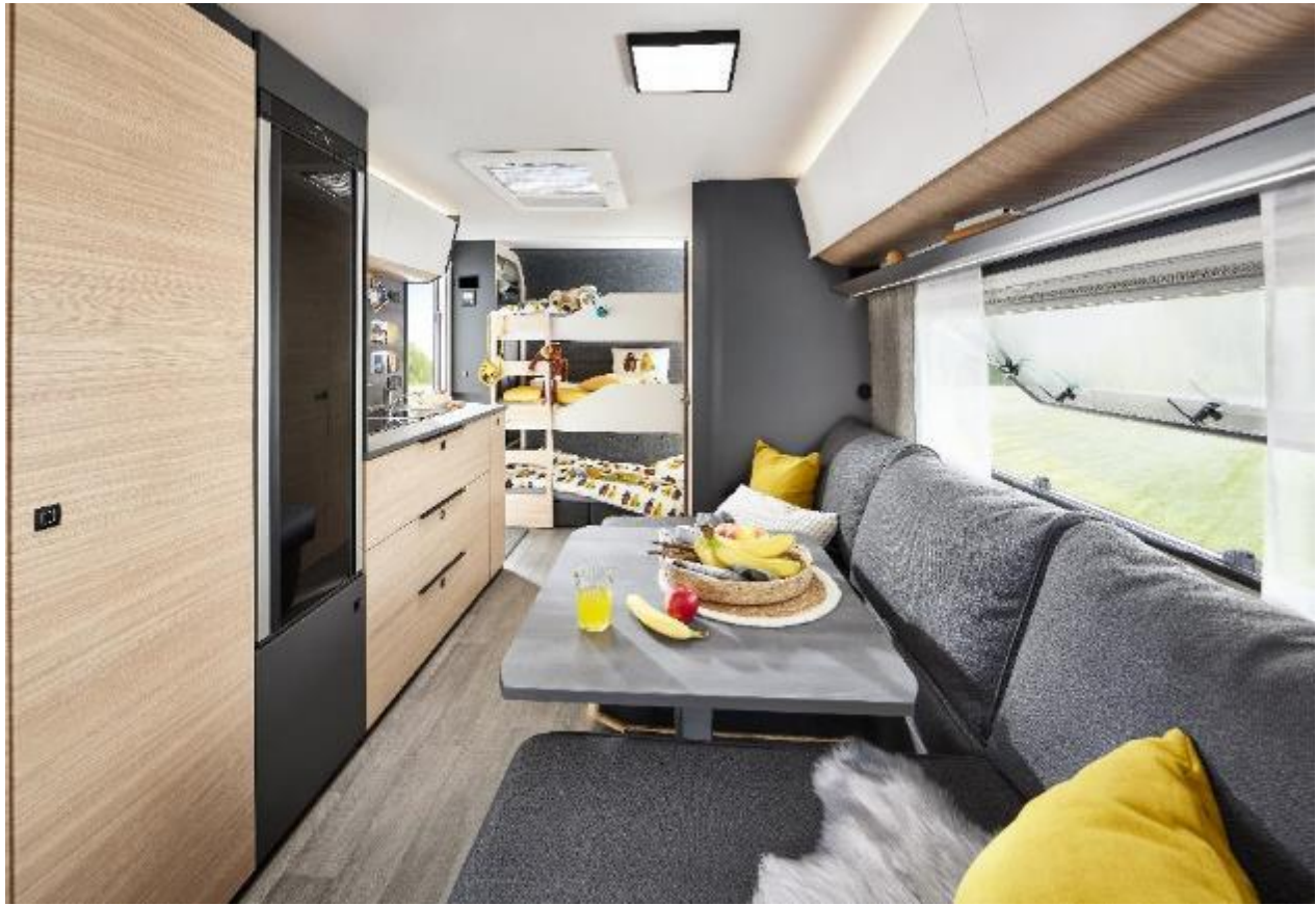
Heckansicht des MAXIA 595 KML mit multifunktionalen Kinderbettbereich.

Die oberen Betten lassen sich durch ein Stecksystem mit Rollrosten und Matratzen im Handumdrehen zu komfortablen Betten mit den Maßen von jeweils 76 x 200 cm auf- und abbauen. Das untere Bett besteht aus drei Polsterkissen und einem Topper mit einer Liegefläche von 73 x 200 cm.