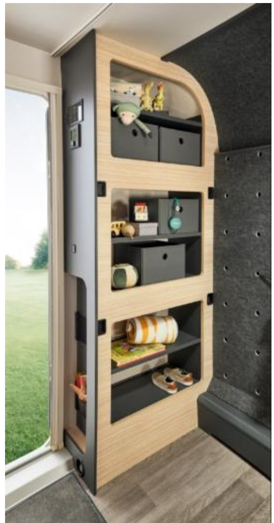
Der multifunktionale Kinderbettbereich des MAXIA 595 KML