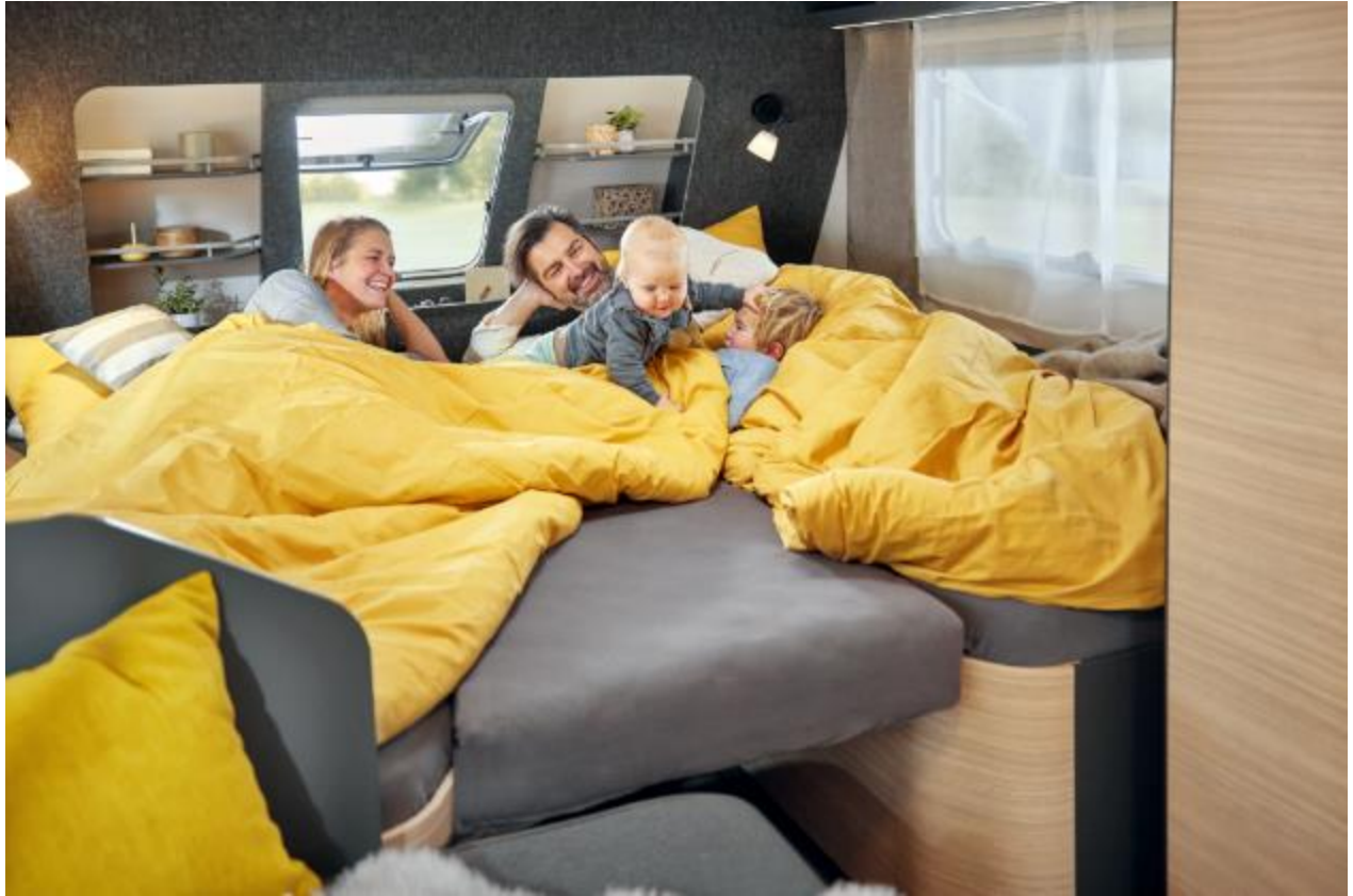
Das gemütliche Familienbett mit optionaler Bettverbreiterung