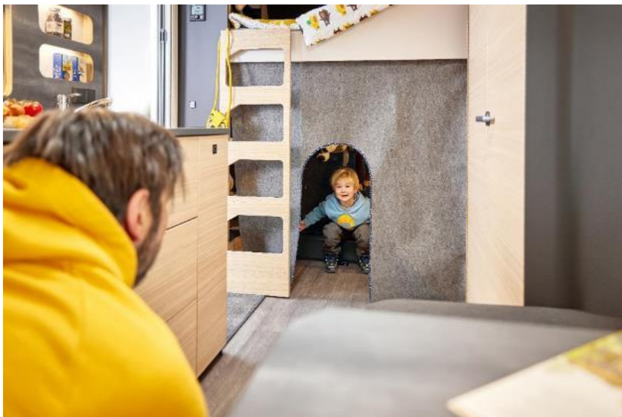
Tagsituation im Kinderbettbereich des MAXIA 595 KML

Auch ohne Etagenbetten lässt sich der Bereich als flexibler Stauraum nutzen. Dafür sind weitere Elemente in Planung – zum Beispiel Regalsysteme, die sich wie alles Zubehör einfach in der Wand verankern lassen.“