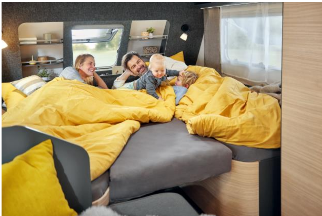
Le lit familial confortable avec extension de lit en option