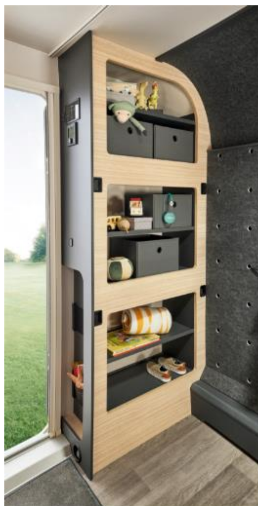
L'espace lit d'enfant multifonctionnel du MAXIA 595 KML