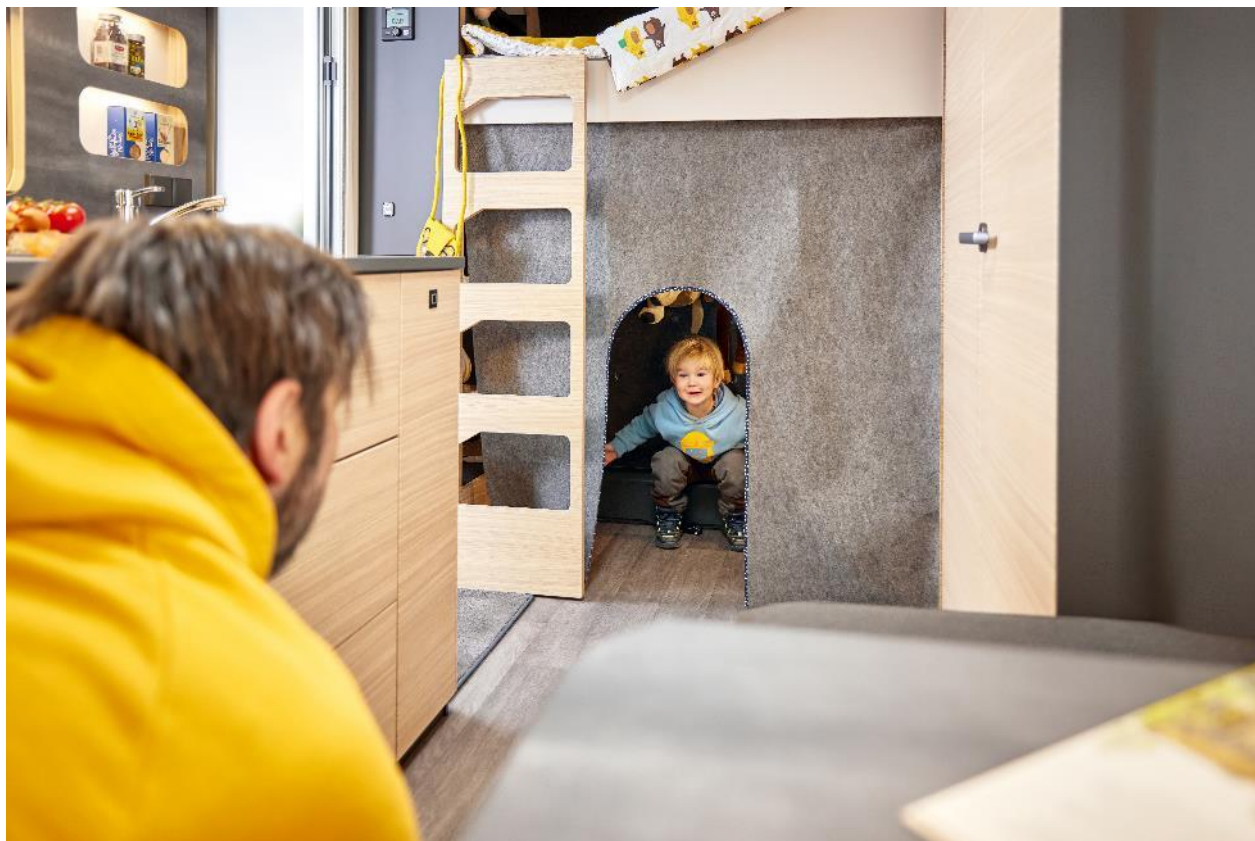
Situation de jour dans la zone du lit d'enfant du MAXIA 595 KML

amis vous accompagnent en vacances, ou lorsque tous les enfants ne sont plus du voyage, mais qu'un chien s'ajoute à l'aventure. Même sans lits superposés, cette chambre peut être utilisée comme espace de rangement modulable. D'autres éléments sont prévus à cet effet, par exemple des systèmes d'étagères qui peuvent être facilement accrochés à la paroi comme tous les accessoires. »