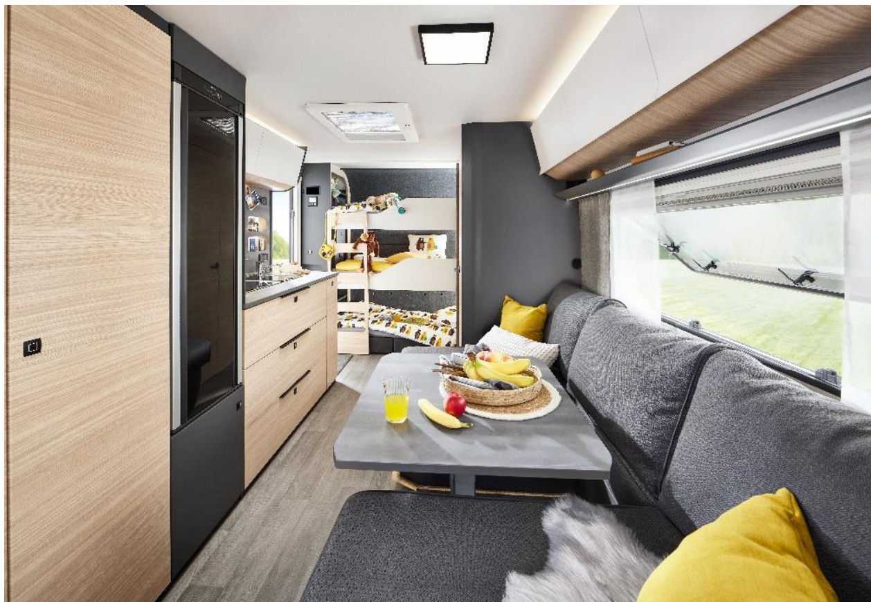
Arrière de la MAXIA 595 KML avec chambre d'enfants multifonction.

À l'arrière, jusqu'à trois lits superposés d'une capacité de charge de 100 kg chacun peuvent être installés. Les lits supérieurs peuvent être montés et démontés en un tour de main grâce à un système modulaire comprenant des sommiers à roulettes et des matelas, pour former des lits confortables de 76 x 200 cm. Le lit inférieur se compose de trois coussins rembourrés et d'un surmatelas pour une surface de couchage de 73 x 200 cm.