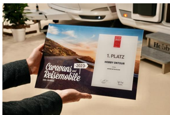
Prämierung der ONTOUR-Baureihe zum „Caravan des Jahres“.

Am Eröffnungssamstag darf sich Hobby über die erneute Prämierung der ONTOUR-Baureihe zum „Caravan des Jahres“ freuen. Bei der Auszeichnung zum Reisemobil des Jahres, die ebenfalls von den Lesern der Promobil und Caravaning gewählt wurden, landet der Optima Ontour Alkoven auf einem guten dritten Platz.