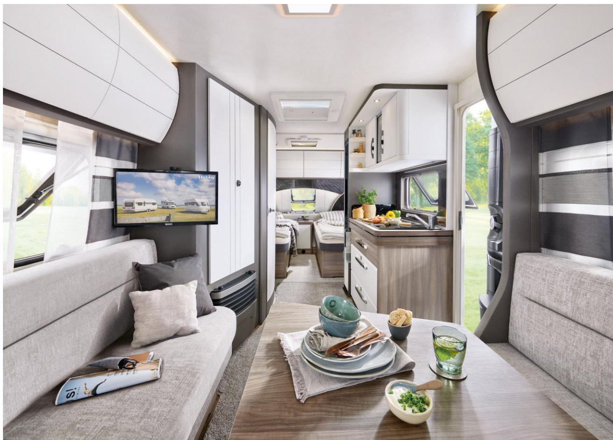
Classique moderne, le modèle EXCELLENT EDITION 495 UL