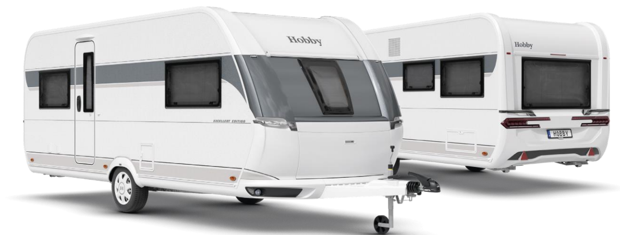
Design extérieur de l'EXCELLENT 540 UFF