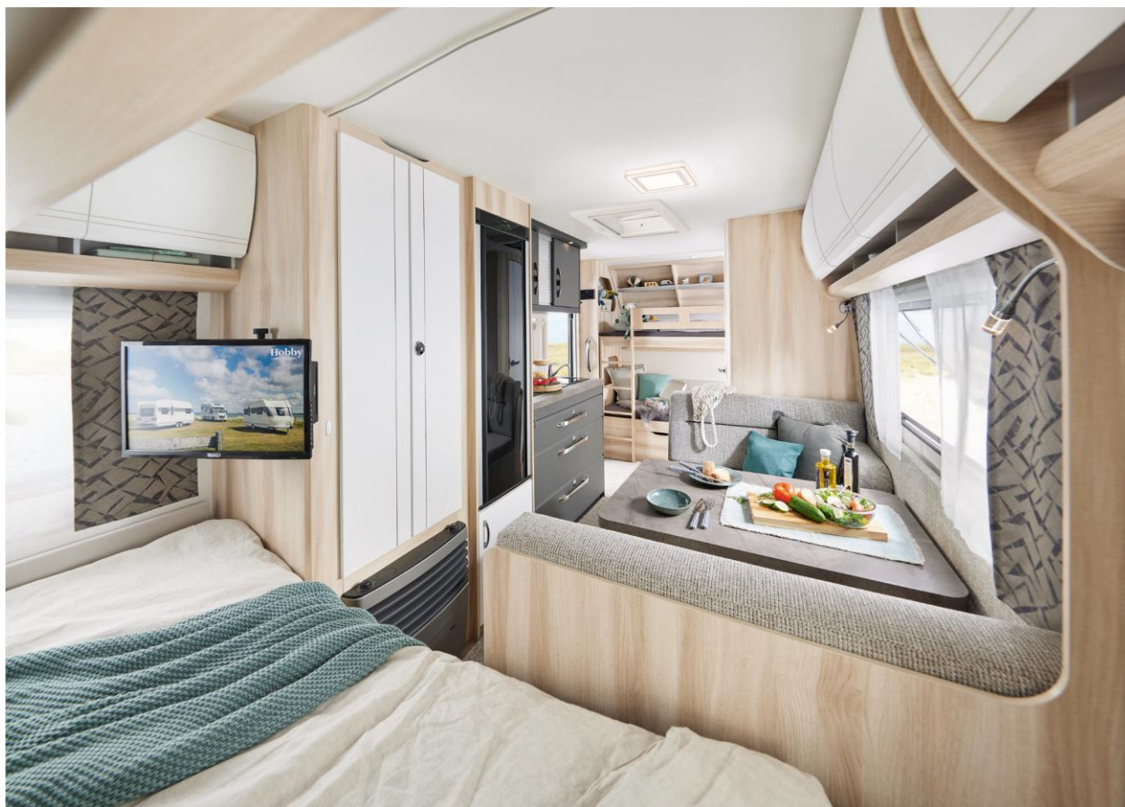
De la place pour tout le monde : DE LUXE 490 KMF