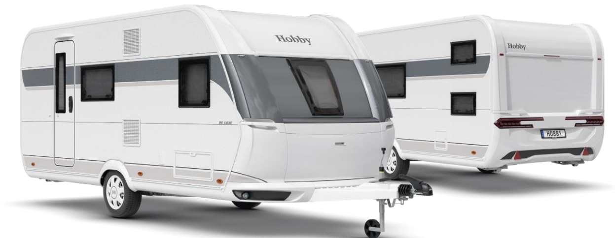
Design extérieur de la DE LUXE 490 KMf

mais s'impose plutôt comme le compagnon de voyage adapté et prêt à rouler au départ usine, pour des vacances parfaites.