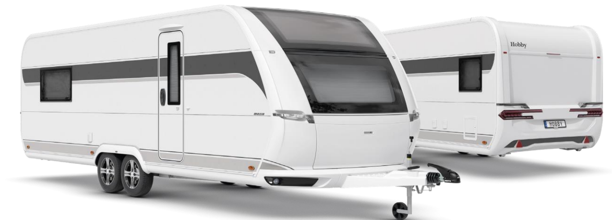
Außendesign des MAXIA 660 WQM