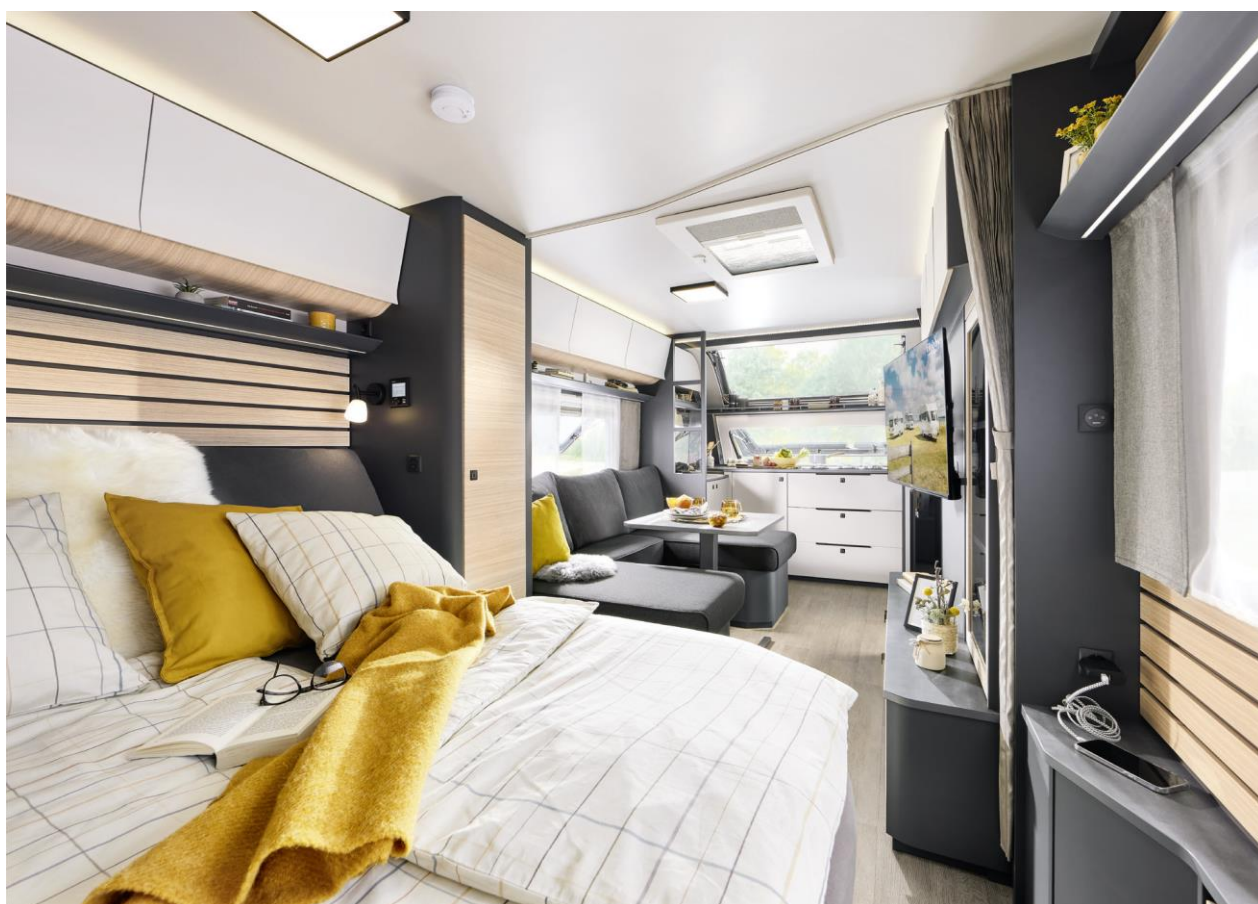
Camping mit Luxusapartmentfeeling: der MAXIA 660 WQM

Großzügiger Waschraum und farblich aufeinander abgestimmter Wohn- und Küchenbereich machen den Premium-Caravan zum Gefährt der Extraklasse. Eines seiner Highlights ist die lichtdurchflutete Bugküche mit 157-L Kühlschrankschrank und einer ausladenden Arbeitsfläche. Die großzügige Couch mit zwei Récamieren rundet das perfekte Wohngefühl ab.