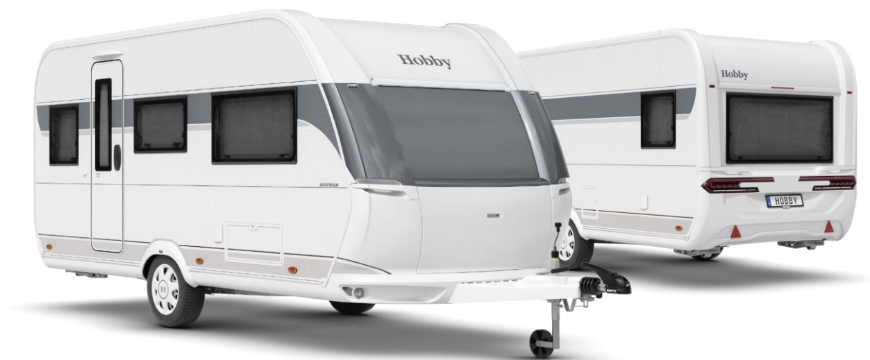
Design extérieur de l'ONTOUR 460 DL