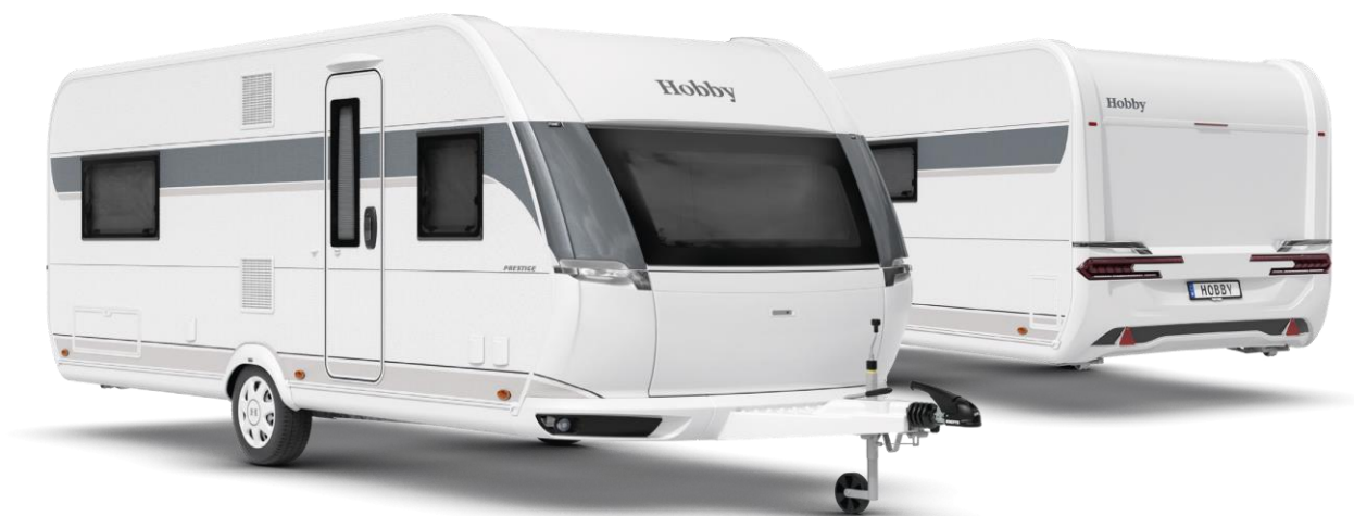
Außendesign des PRESTIGE 560 FC